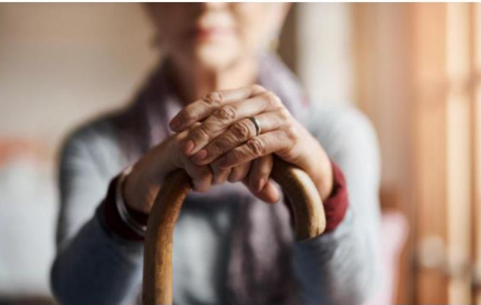
Certains seniors sont en colère : «À 20 ans, mon mari faisait l'Indochine, mon père la guerre de 39-45 et mes grands-pères, Verdun... Il ne faut pas nous stigmatiser».

Abonnés Cet article est réservé aux abonnés.